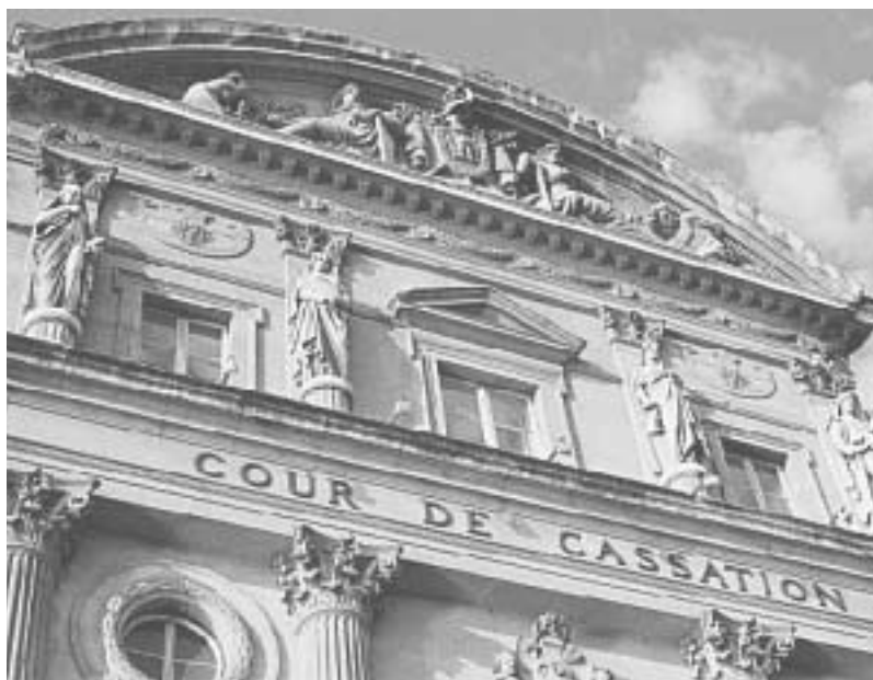
Cour de cassation

En effet, le CFC rencontre régulièrement des difficultés pour faire sanctionner des utilisations non autorisées d'œuvres protégées et les procédures engagées durent souvent plusieurs années ce qui amoindrit fortement leur efficacité.